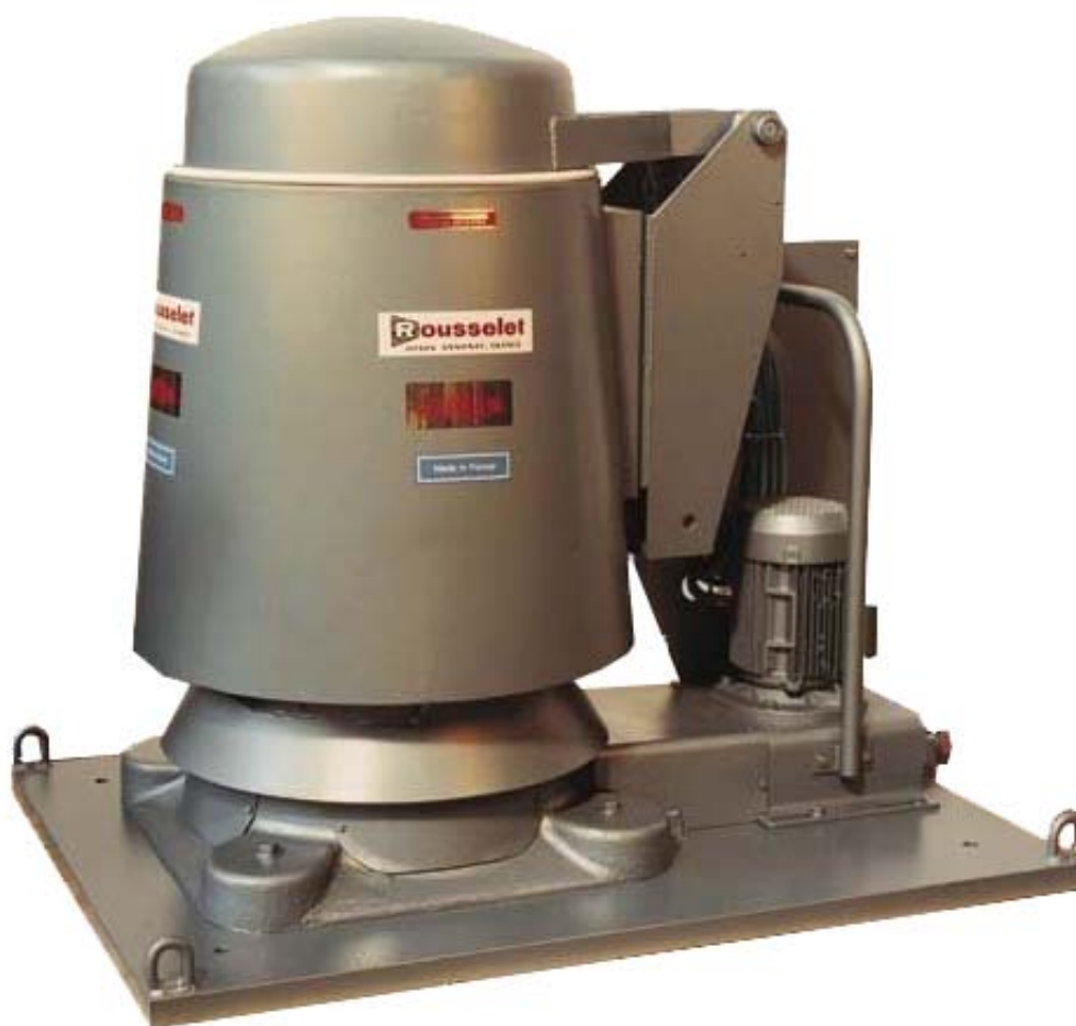
Вид RC 60 KG с автоматическим управлением барабана

Гидро экстрактор со съёмным барабаном. Для сокращения времени на операцию осушительная фаза начинается сразу после закрытия крышки. Лишний материал устраняется через нижнюю часть механизма.