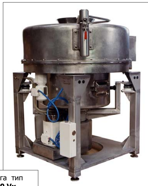
Центрифуга тип RCPC 70 Vx

Центрифугу RCPC 60 Vx можно легко адаптировать и установить прямо на перерабатывающем заводе так, чтобы она наиболее соответствовала перерабатываемому продукту, с помощью изменения скорости и циклов выгрузки.