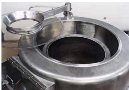
Крышка на вращающейся задвижке